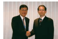
2012年10月福島県副知事 表敬訪問