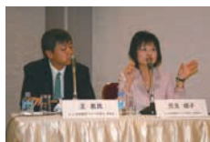
2008年12月デバイスラグ 記者説明会