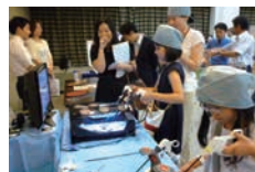
2012年8月こども霞が関見学 デーの体験ブース