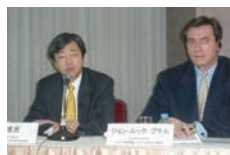
2006年12月患者アクセス 意見書記者説明会