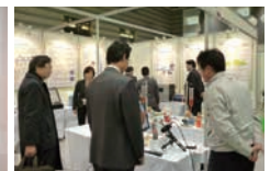
2012年11月メディカル クリエイションふくしま2012