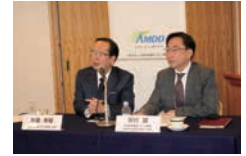
2018年1月年頭会見 MTPI設立発表