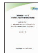
2011年9月 「医療機器におけ る日中韓三カ国の 市場環境比較調査」