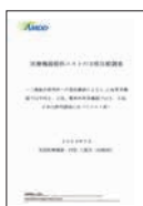
2009年7月 「医療機器提供 コストの日欧 比較調査」