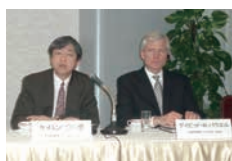
2009年4月 AMDD設立記者発表