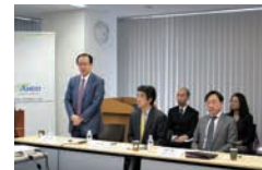
2017年2月バリューベース 償還制度記者説明会