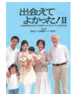
2014年4月 エッセー集 II