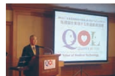
2003年から始まった メディアレクチャー