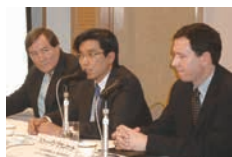
2007年11月 メディアフォーラム 「これからの日本の医療を考える」